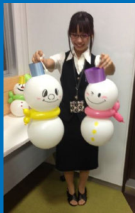
手で持つことも可能