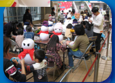
写真は 教室風景 イメージです