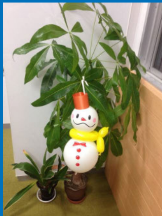
吊り下げイメージ